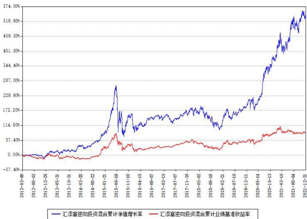
汇添富逆向投资混合累计净值增长率与同期业绩基准收益率对比图

注：本基金建仓期为本《基金合同》生效之日（2012年03月09日）起6个月，建仓期结束时各项资产配置比例符合合同约定。