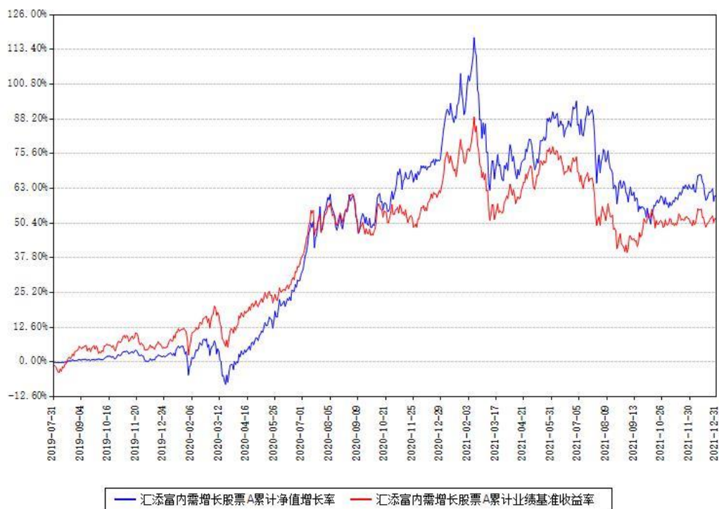
汇添富内需增长股票A累计净值增长率与同期业绩基准收益率对比图