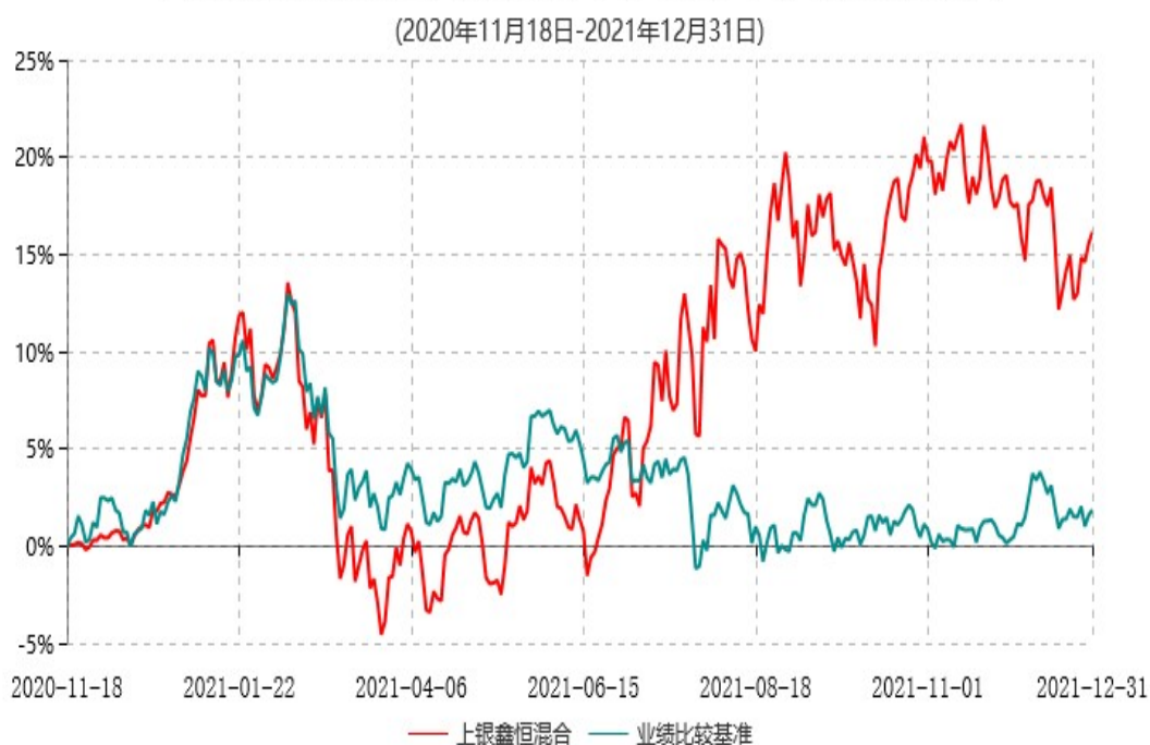
上银鑫恒混合型证券投资基金累计净值增长率与业绩比较基准收益率历史走势对比图

注：本基金合同生效日为2020年11月18日，自基金合同生效日起6个月内为建仓期，建仓期结束时各项资产配置比例符合基金合同约定。