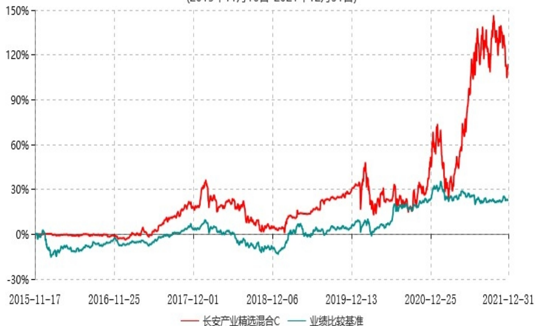
长安产业精选混合C累计净值增长率与业绩比较基准收益率历史走势对比图 (2015年11月16日-2021年12月31日)

长安产业精选混合 A 生效日为 2014 年 05 月 07 日，按基金合同规定，本基金自基金合同生效起 6 个月为建仓期，截止到建仓期结束时，本基金的各项投资组合比例已符合基金合同的相关规定。基金合同生效日至报告期期末，本基金运作时间超过一年，图示日期为 2014 年 05 月 07 日至 2021 年 12 月 31 日。