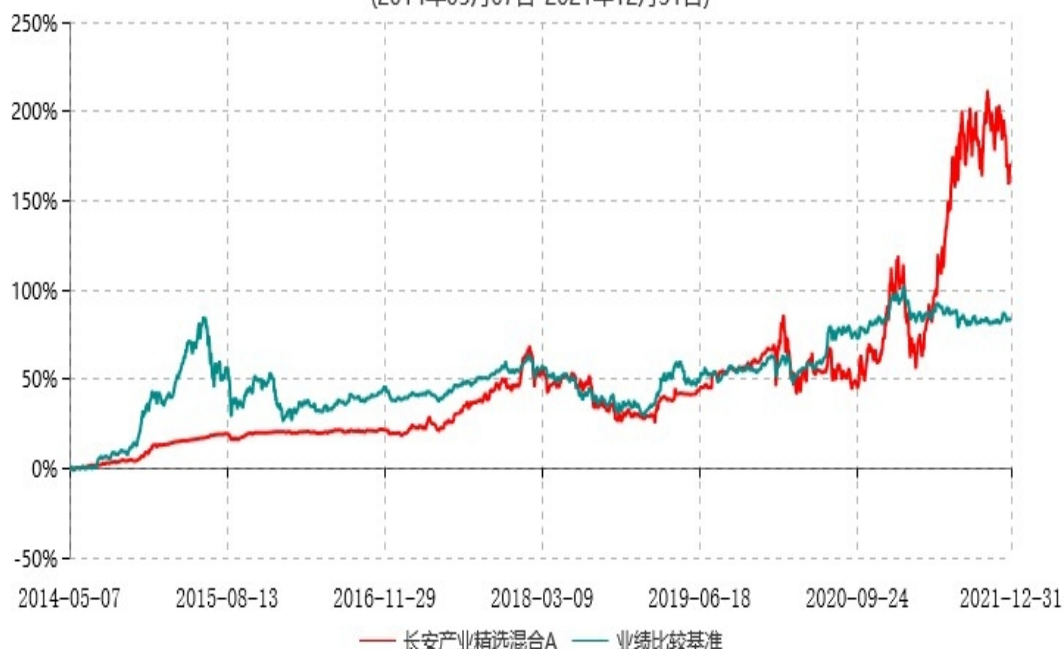
长安产业精选混合A累计净值增长率与业绩比较基准收益率历史走势对比图 (2014年05月07日-2021年12月31日)

长安产业精选混合 A 生效日为 2014 年 05 月 07 日，按基金合同规定，本基金自基金合同生效起 6 个月为建仓期，截止到建仓期结束时，本基金的各项投资组合比例已符合基金合同的相关规定。基金合同生效日至报告期期末，本基金运作时间超过一年，图示日期为 2014 年 05 月 07 日至 2021 年 12 月 31 日。