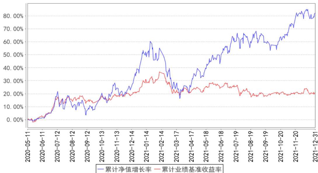
华宝成长策略混合累计净值增长率与同期业绩比较基准收益率的历史走势对比图

注：按照基金合同的约定，基金管理人应当自基金合同生效之日起 6 个月内使基金的投资组合比例符合基金合同的有关约定，截至 2020 年 11 月 09 日，本基金已达到合同规定的资产配置比例。