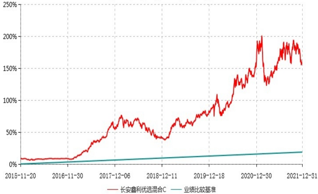
长安鑫利优选混合C累计净值增长率与业绩比较基准收益率历史走势对比图 (2015年11月20日-2021年12月31日)

长安鑫利优选混合于 2015 年 11 月 17 日公告新增 C 类份额，实际首笔 C 类份额申购申请于 2015 年 11 月 20 日确认，图示日期为 2015 年 11 月 20 日至 2021 年 12 月 31 日。