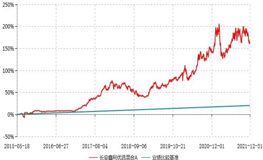
长安鑫利优选混合A累计净值增长率与业绩比较基准收益率历史走势对比图 (2015年05月18日-2021年12月31日)

本基金基金合同生效日为 2015 年 05 月 18 日，按基金合同规定，本基金自基金合同生效起 6 个月为建仓期，截止到建仓期结束时，本基金的各项投资组合比例已符合基金合同的相关规定。图示日期为 2015 年 05 月 18 日至 2021 年 12 月 31 日。