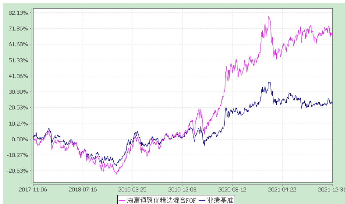
海富通聚优精选混合型基金中基金（FOF） 份额累计净值增长率与业绩比较基准收益率的历史走势对比图 （2017 年 11 月 6 日至 2021 年 12 月 31 日）

注：本基金合同于 2017 年 11 月 6 日生效，按基金合同规定，本基金自基金合同生效起