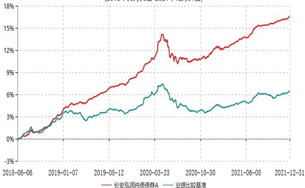
长安泓润纯债债券A累计净值增长率与业绩比较基准收益率历史走势对比图 (2018年06月06日-2021年12月31日)

根据基金合同的规定，自基金合同生效日起 6 个月内基金各项资产配置比例需符合基金合同要求。本基金在建仓期结束后，各项资产配置比例已符合基金合同有关投资比例的约定。基金合同生效日至报告期末，本基金运作时间已满一年。图示日期为 2018 年 6 月 6 日至 2021 年 12 月 31 日。