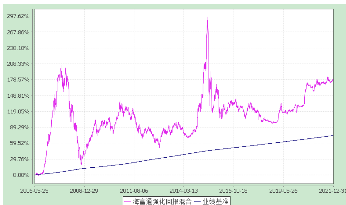
海富通强化回报混合型证券投资基金 份额累计净值增长率与业绩比较基准收益率的历史走势对比图 (2006年5月25日至2021年12月31日)

注：按照本基金合同规定,本基金建仓期为基金合同生效之日起六个月。建仓期满至今,本基金投资组合均达到本基金合同第十二条(二)、(七)规定的比例限制及本基金投资组合的比例范围。