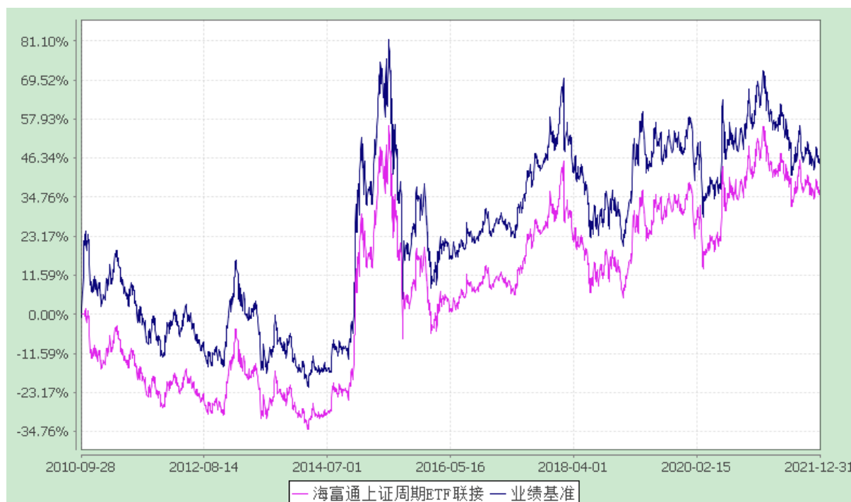
份额累计净值增长率与业绩比较基准收益率的历史走势对比图 (2010 年 9 月 28 日至 2021 年 12 月 31 日)

注：按照本基金合同规定，本基金建仓期为基金合同生效之日起三个月。截至报告期末本基金的各项投资比例已达到基金合同第十一部分（二）投资范围、（六）投资限制中规定的各项比例。