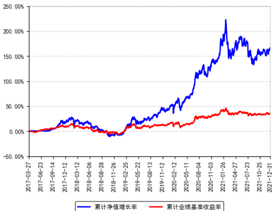
南方智慧精选灵活配置混合累计净值增长率与同期业绩比较基准收益率的历史走势对比图