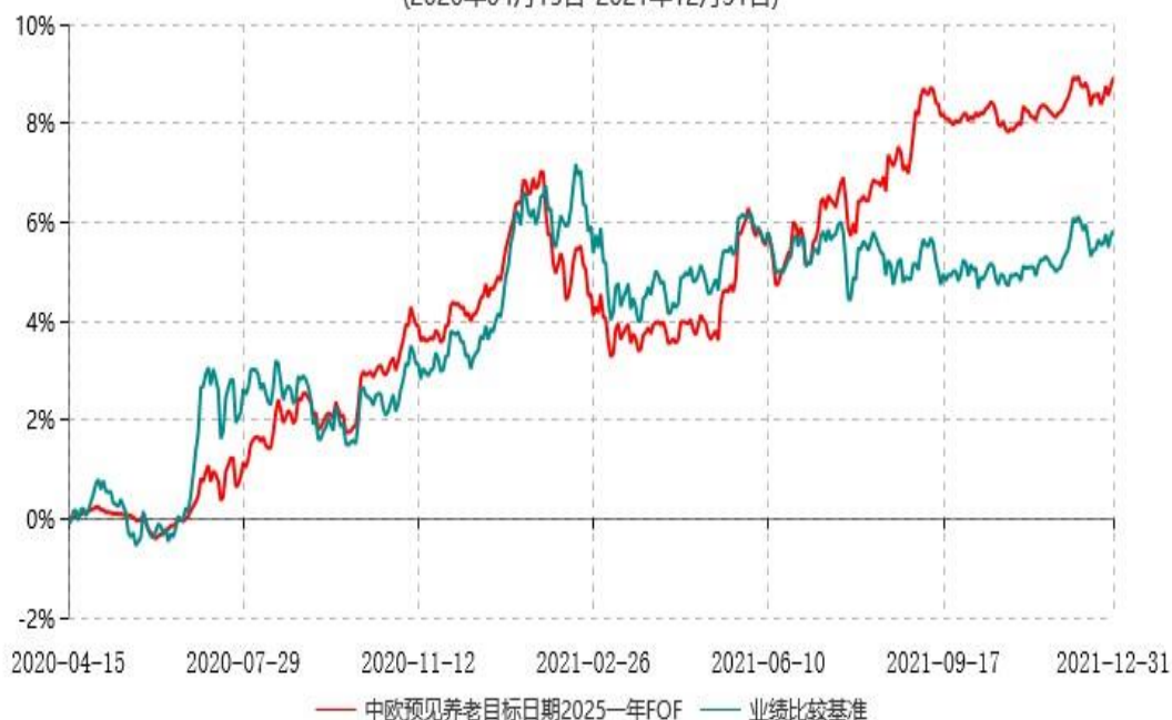
中欧预见养老目标日期2025一年持有期混合型基金中基金（FOF）累计净值增长率与业绩比较基准收益率历史走势对比图 (2020年04月15日-2021年12月31日)