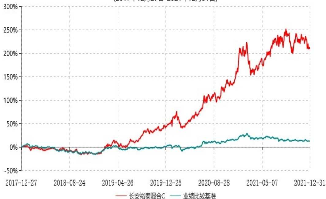
长安裕泰混合C累计净值增长率与业绩比较基准收益率历史走势对比图 (2017年12月27日-2021年12月31日)

根据基金合同的规定,自基金合同生效之日起6个月内基金各项资产配置比例需符合基金合同要求。本基金在建仓期结束后,各项资产配置比例已符合基金合同有关投资比例的约定。基金合同生效日至报告期期末,本基金运作时间超过一年。图示日期为2017年12月27日至2021年12月31日。