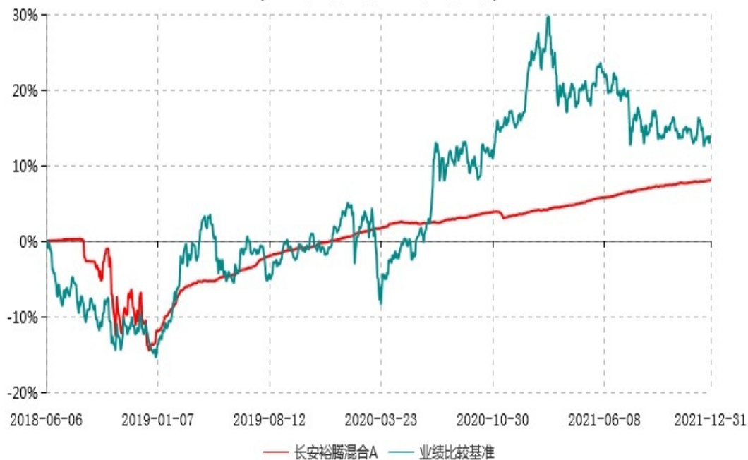
长安裕腾混合A累计净值增长率与业绩比较基准收益率历史走势对比图 (2018年06月06日-2021年12月31日)

根据基金合同的规定,自基金合同生效之日起 6 个月内基金各项资产配置比例需符合基金合同要求。本基金在建仓期结束后,各项资产配置比例已符合基金合同有关投资比例的约定。基金合同生效日至报告期末,本基金运作时间已满一年。图示日期为 2018 年 06 月 06 日至 2021 年 12 月 31 日。