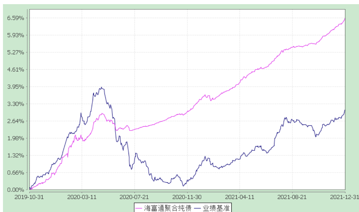
海富通聚合纯债债券型证券投资基金 份额累计净值增长率与业绩比较基准收益率的历史走势对比图 (2019 年 10 月 31 日至 2021 年 12 月 31 日)

注：本基金合同于 2019 年 10 月 31 日生效。按基金合同规定，本基金自基金合同生效起 6 个月内为建仓期。建仓期结束时本基金的各项投资比例已达到基金合同第十二部分（二）投资范围、（四）投资限制中规定的各项比例。