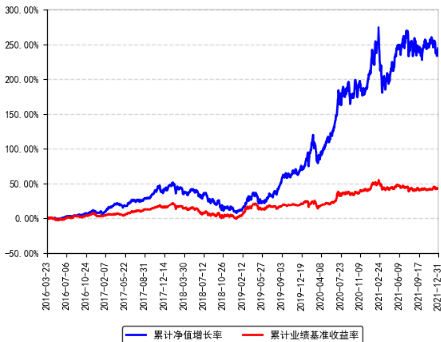
南方转型驱动灵活配置混合累计净值增长率与同期业绩比较基准收益率的历史走势对比图