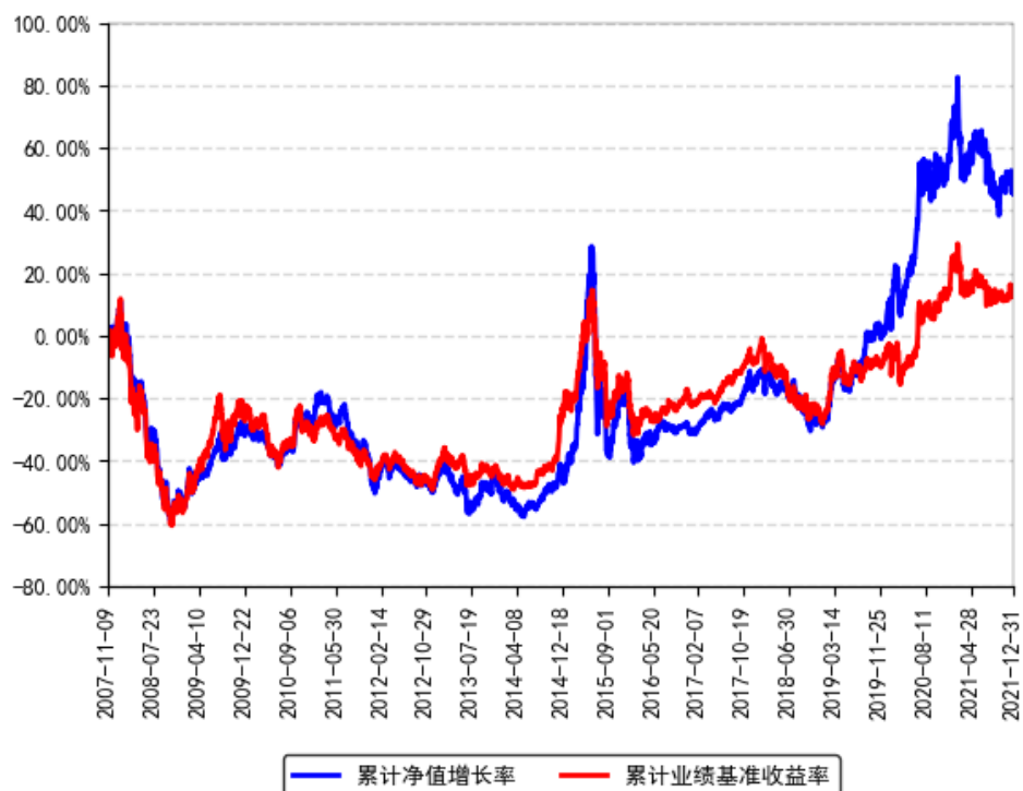
南方隆元产业主题混合累计净值增长率与同期业绩比较基准收益率的历史走势对比图

注：本基金自 2007 年 11 月 09 日由封闭式基金隆元证券投资基金转型而成。