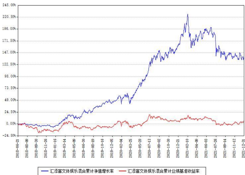
汇添富文体娱乐混合累计净值增长率与同期业绩基准收益率对比图

注：本基金建仓期为本《基金合同》生效之日（2018年06月21日）起6个月，建仓期结束时各项资产配置比例符合合同约定。