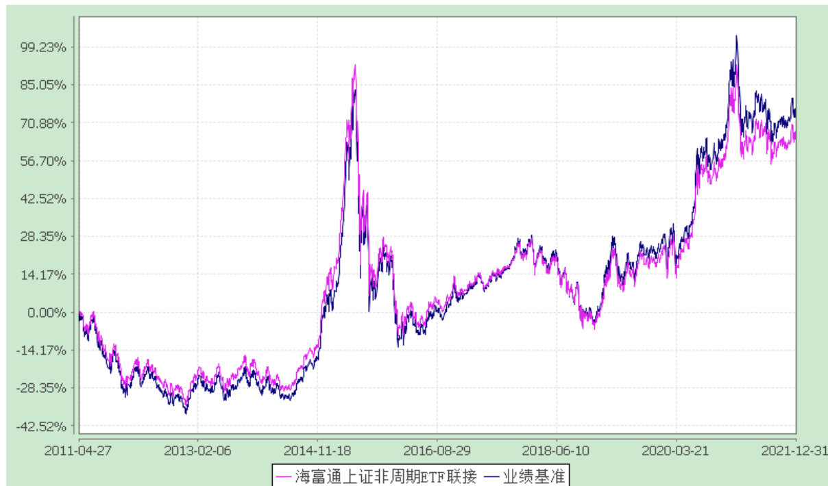
海富通上证非周期行业 100 交易型开放式指数证券投资基金联接基金 份额累计净值增长率与业绩比较基准收益率的历史走势对比图 (2011 年 4 月 27 日至 2021 年 12 月 31 日)

注：按照本基金合同规定，本基金建仓期为基金合同生效之日起三个月。截至报告期末本基金的各项投资比例已达到基金合同第十一部分（二）投资范围、（六）投资限制中规定的各项比例。