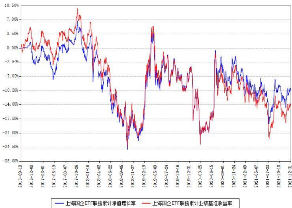
上海国企ETF联接累计净值增长率与同期业绩基准收益率对比图

注：本基金建仓期为本《基金合同》生效之日（2016年09月18日）起6个月，建仓期结束时各项资产配置比例符合合同约定。