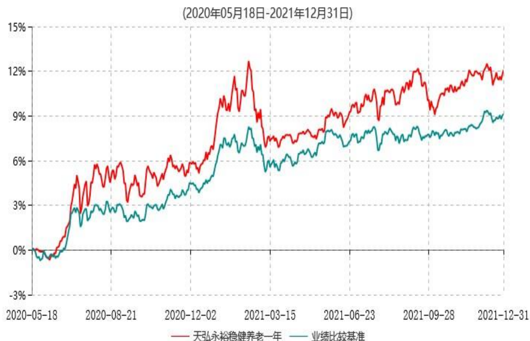
天弘永裕稳健养老目标一年持有期混合型基金中基金（FOF）累计净值增长率与业绩比较基准收益率历史走势对比图