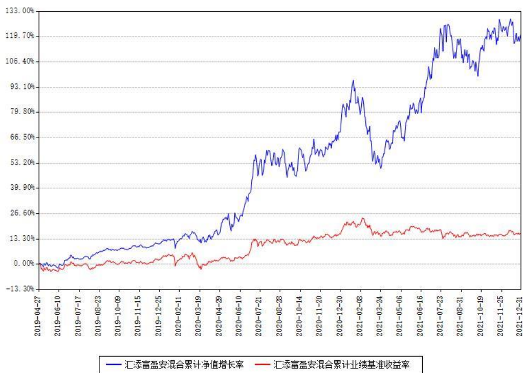
汇添富盈安混合累计净值增长率与同期业绩基准收益率对比图

注：1、本基金由原汇添富盈安保本混合型证券投资基金于 2019 年 4 月 27 日转型而来。 2、本基金建仓期为《基金合同》生效之日起 6 个月，建仓期结束时各项资产配置比例符合合同约定。