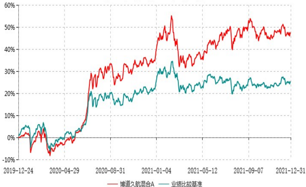
博道久航混合A累计净值增长率与业绩比较基准收益率历史走势对比图 (2019年12月24日-2021年12月31日)

注：本基金建仓期为自基金合同生效日起的6个月。截至建仓期结束，本基金各项资产配置比例符合基金合同及招募说明书有关投资比例的约定。