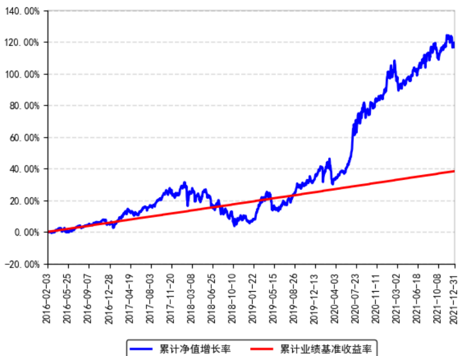
南方君选灵活配置混合累计净值增长率与同期业绩比较基准收益率的历史走势对比图