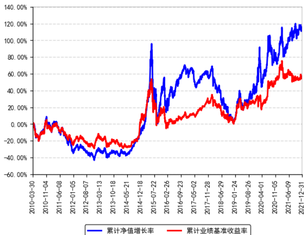
南方策略优化混合累计净值增长率与同期业绩比较基准收益率的历史走势对比图