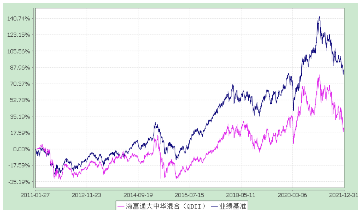
海富通大中华精选混合型证券投资基金 份额累计净值增长率与业绩比较基准收益率历史走势对比图 (2011 年 1 月 27 日至 2021 年 12 月 31 日)