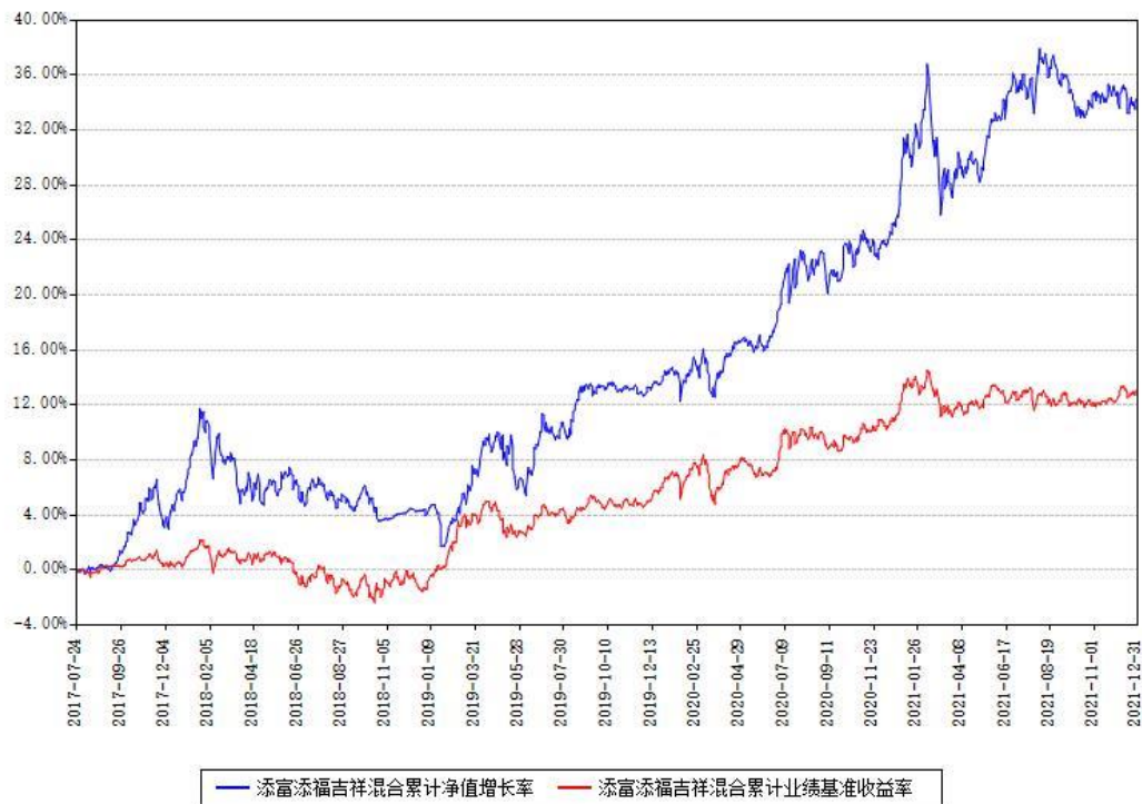
添富添福吉祥混合累计净值增长率与同期业绩基准收益率对比图

注：本基金建仓期为本《基金合同》生效之日（2017年07月24日）起6个月，建仓期结束各项资产配置比例符合合同约定。