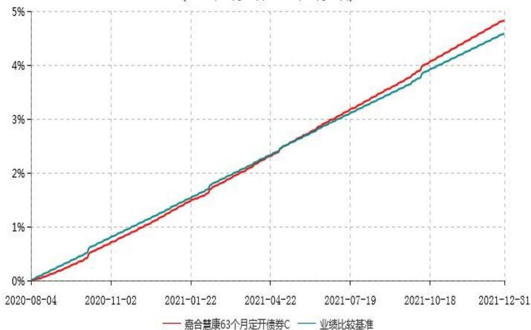
嘉合慧康63个月定开债券C累计净值增长率与业绩比较基准收益率历史走势对比图 (2020年08月04日-2021年12月31日)

注：本基金基金合同于 2020 年 08 月 04 日生效，按照基金合同规定，本基金建仓期为基金合同生效之日起 6 个月。建仓期结束时，本基金的各项资产配置比例符合基金合同约定。