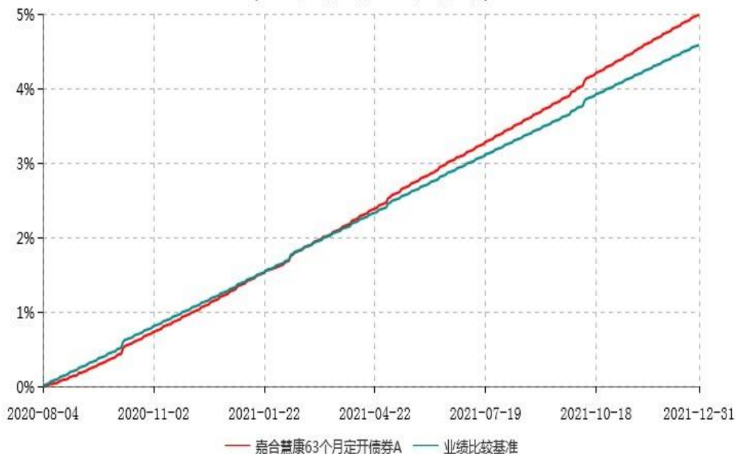
嘉合慧康63个月定开债券A累计净值增长率与业绩比较基准收益率历史走势对比图 (2020年08月04日-2021年12月31日)

注：本基金基金合同于 2020 年 08 月 04 日生效，按照基金合同规定，本基金建仓期为基金合同生效之日起 6 个月。建仓期结束时，本基金的各项资产配置比例符合基金合同约定。