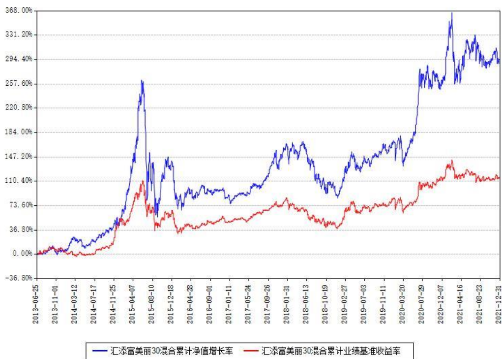
汇添富美丽30混合累计净值增长率与同期业绩基准收益率对比图

注：本基金建仓期为本《基金合同》生效之日（2013年06月25日）起6个月，建仓期结束时各项资产配置比例符合合同约定。