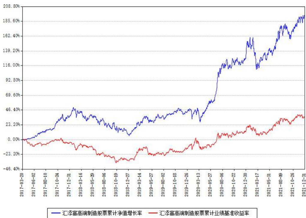
汇添富高端制造股票累计净值增长率与同期业绩基准收益率对比图

注：本基金建仓期为本《基金合同》生效之日（2017年03月20日）起6个月，建仓期结束时各项资产配置比例符合合同约定。