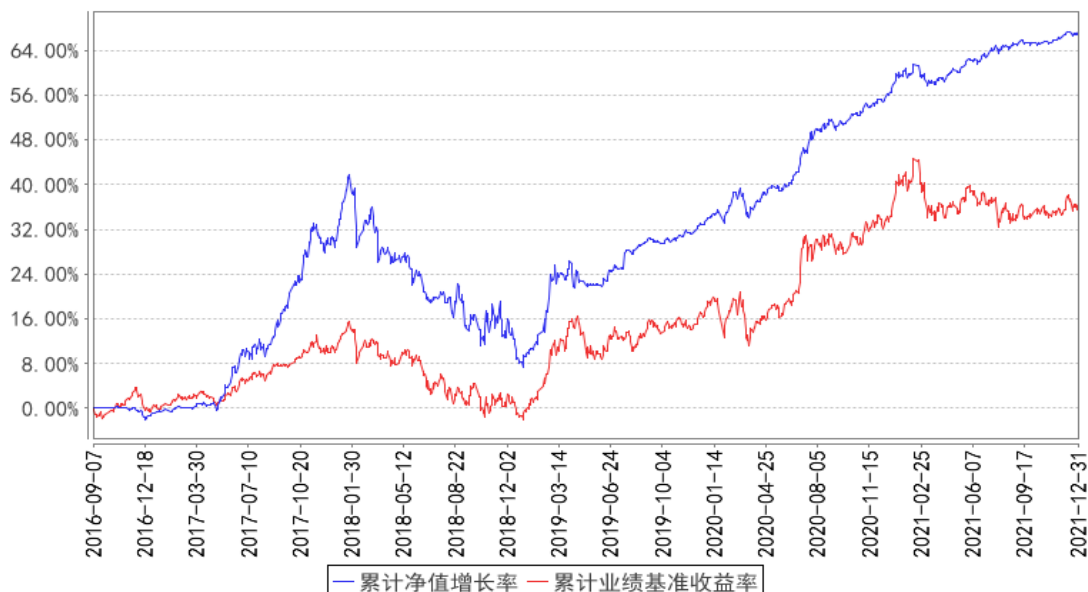
华宝新活力混合累计净值增长率与同期业绩比较基准收益率的历史走势对比图

注：按照基金合同的约定，基金管理人应当自基金合同生效之日起 6 个月内使基金的投资组合比例符合基金合同的有关约定，截至 2017 年 03 月 07 日，本基金已达到合同规定的资产配置比例。