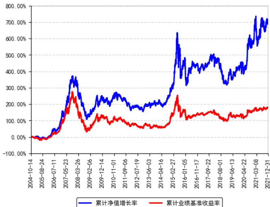
南方积极配置混合 (LOF) 累计净值增长率与同期业绩比较基准收益率的历史走势对比图