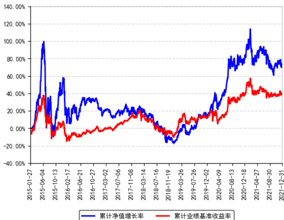
南方产业活力股票累计净值增长率与同期业绩比较基准收益率的历史走势对比图