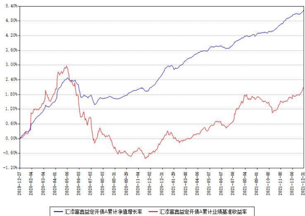
汇添富鑫益定开债A累计净值增长率与同期业绩基准收益率对比图