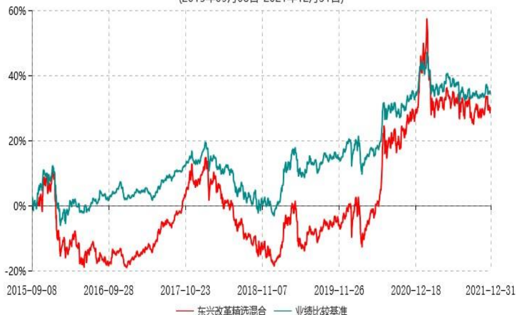
东兴改革精选灵活配置混合型证券投资基金累计净值增长率与业绩比较基准收益率历史走势对比图 (2015年09月08日-2021年12月31日)

注：1、本基金基金合同生效日为2015年9月8日，根据相关法律法规和基金合同，本基金建仓期为基金合同生效之日起6个月内； 2、建仓期结束时各项资产配置比例符合合同约定。