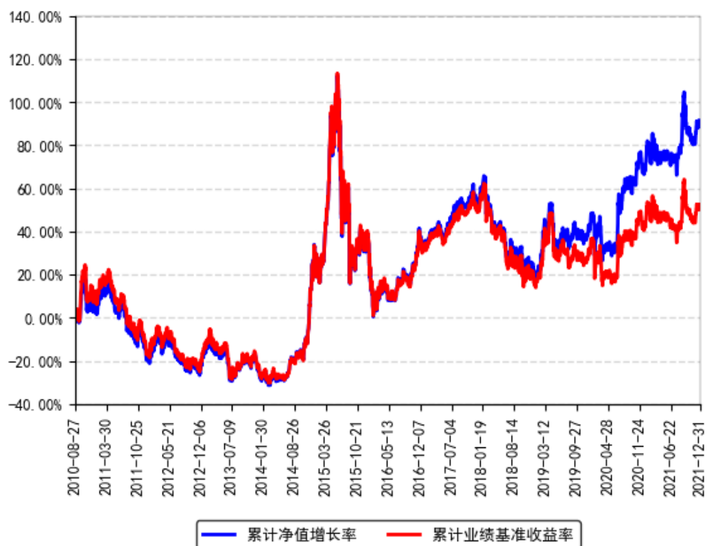
南方小康ETF累计净值增长率与同期业绩比较基准收益率的历史走势对比图