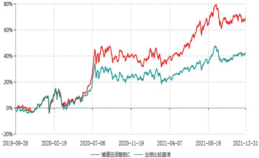
博道伍佰智航C累计净值增长率与业绩比较基准收益率历史走势对比图 (2019年09月26日-2021年12月31日)

注：本基金建仓期为自基金合同生效日起的 6 个月。截至建仓期结束，本基金各项资产配置比例符合基金合同及招募说明书有关投资比例的约定。