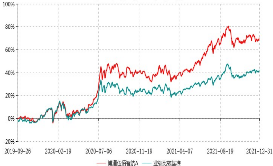
博道伍佰智航A累计净值增长率与业绩比较基准收益率历史走势对比图 (2019年09月26日-2021年12月31日)

注：本基金建仓期为自基金合同生效日起的6个月。截至建仓期结束，本基金各项资产配置比例符合基金合同及招募说明书有关投资比例的约定。