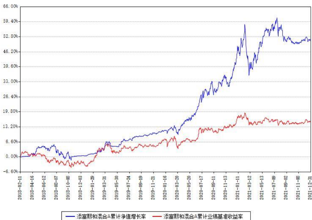
添富熙和混合A累计净值增长率与同期业绩基准收益率对比图