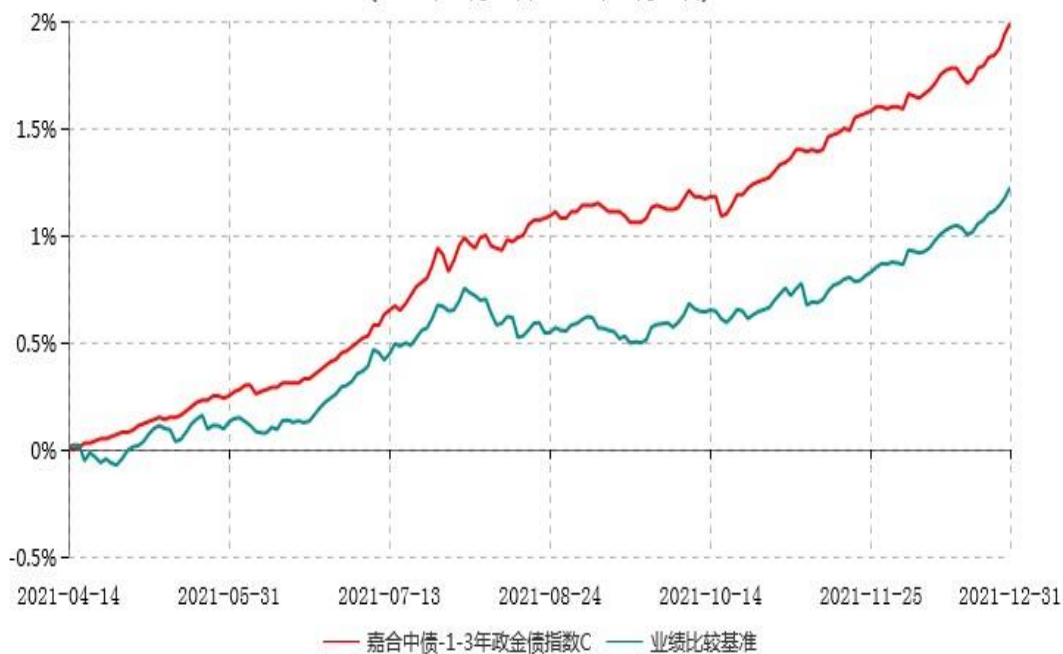
嘉合中债-1-3年政金债指数C累计净值增长率与业绩比较基准收益率历史走势对比图 (2021年04月14日-2021年12月31日)

注：1、本基金合同于 2021 年 04 月 14 日生效，截至报告期末本基金合同生效未满一年。 2、按基金合同规定，本基金自合同生效起 6 个月内为建仓期。建仓期结束时，本基金的各项资产配置比例符合基金合同约定。