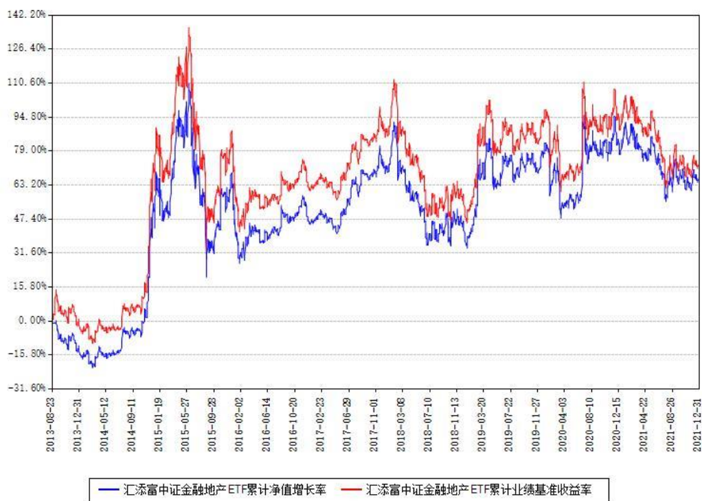
汇添富中证金融地产ETF累计净值增长率与同期业绩基准收益率对比图

注：本基金建仓期为本《基金合同》生效之日（2013年08月23日）起3个月，建仓期结束时各项资产配置比例符合合同约定。