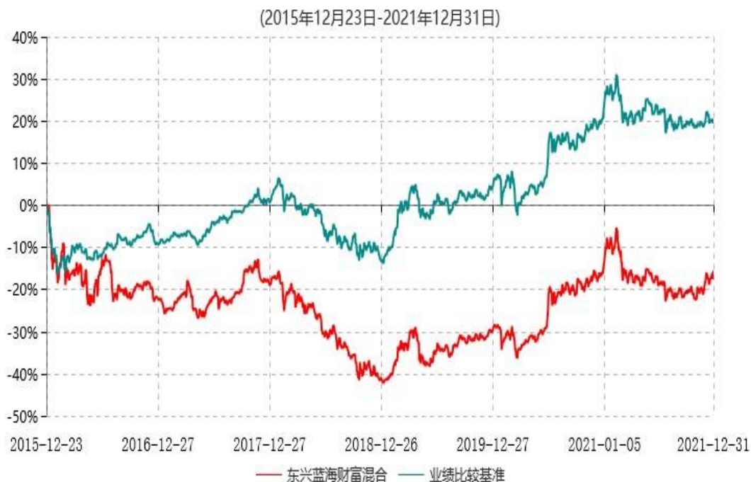
东兴蓝海财富灵活配置混合型证券投资基金累计净值增长率与业绩比较基准收益率历史走势对比图

注：1、本基金基金合同生效日为2015年12月23日，根据相关法律法规和基金合同，本基金建仓期为基金合同生效之日起6个月内；