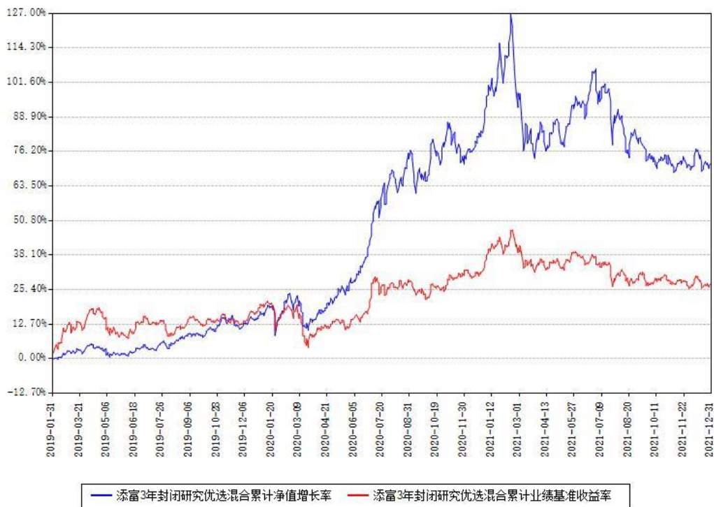
添富3年封闭研究优选混合累计净值增长率与同期业绩比较基准收益率对比图

注：本基金建仓期为本《基金合同》生效之日（2019年01月31日）起6个月，建仓期结束时各项资产配置比例符合合同约定。