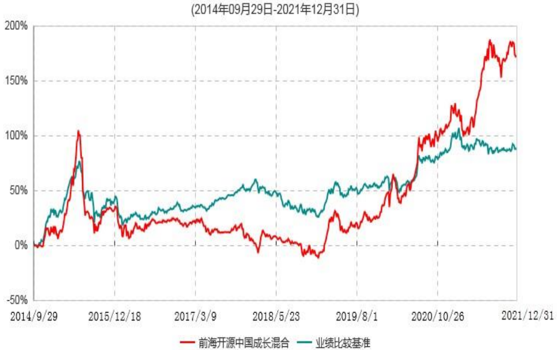
前海开源中国成长灵活配置混合型证券投资基金累计净值增长率与业绩比较基准收益率历史走势对比图