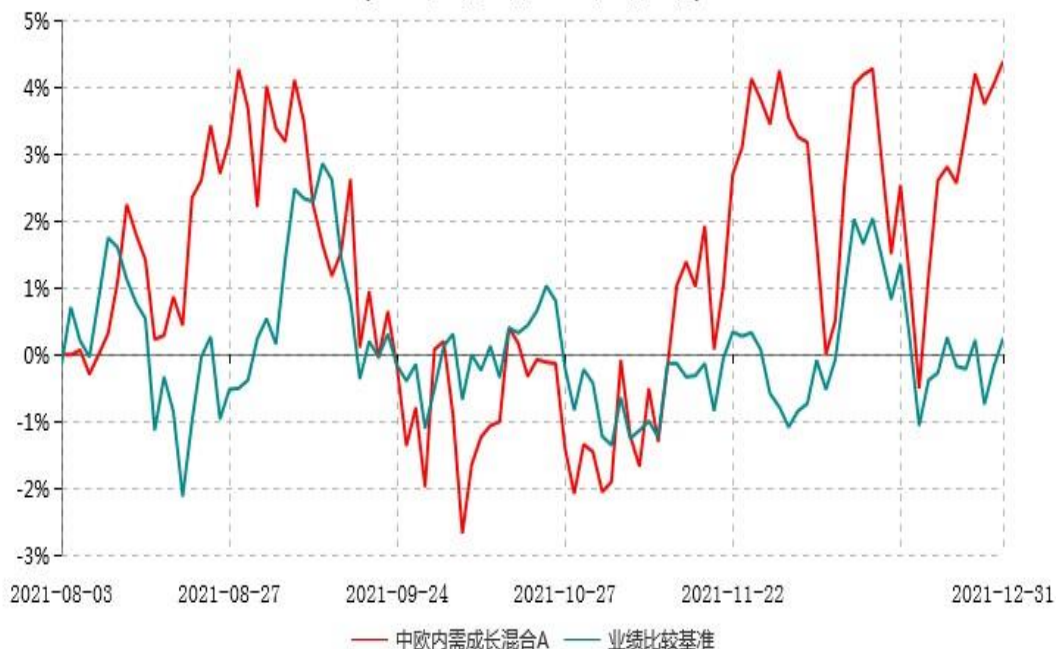
中欧内需成长混合A累计净值增长率与业绩比较基准收益率历史走势对比图 (2021年08月03日-2021年12月31日)

注：本基金基金合同生效日期为2021年8月3日，自基金合同生效日起到本报告期末不满一年，按基金合同的规定，本基金自基金合同生效起六个月为建仓期，建仓期结束时各项资产配置比例应当符合基金合同约定。