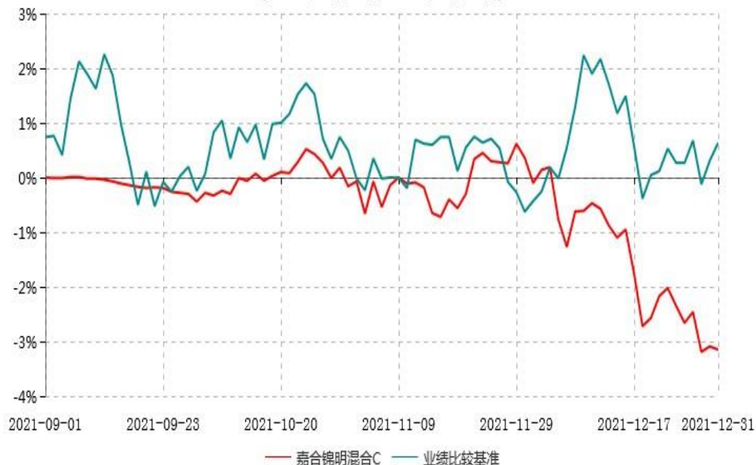
嘉合锦明混合C累计净值增长率与业绩比较基准收益率历史走势对比图 (2021年09月01日-2021年12月31日)

注：1、本基金基金合同于 2021 年 09 月 01 日生效。截至本报告期末，本基金基金合同生效不满一年。