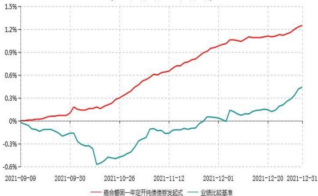
嘉合磐固一年定期开放纯债债券型发起式证券投资基金累计净值增长率与业绩比较基准收益率历史走势对比图 (2021年09月09日-2021年12月31日)

注：1、本基金合同于2021年9月9日生效，截至报告期末本基金合同生效未满一年。 2、按基金合同规定，本基金自合同生效起6个月内为建仓期。