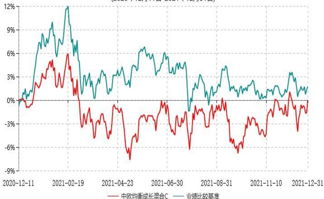
中欧均衡成长混合C累计净值增长率与业绩比较基准收益率历史走势对比图 (2020年12月11日-2021年12月31日)

注：本基金基金合同生效日期为2020年12月11日，按基金合同的规定，本基金自基金合同生效起六个月为建仓期，建仓期结束时各项资产配置比例已符合基金合同约定。