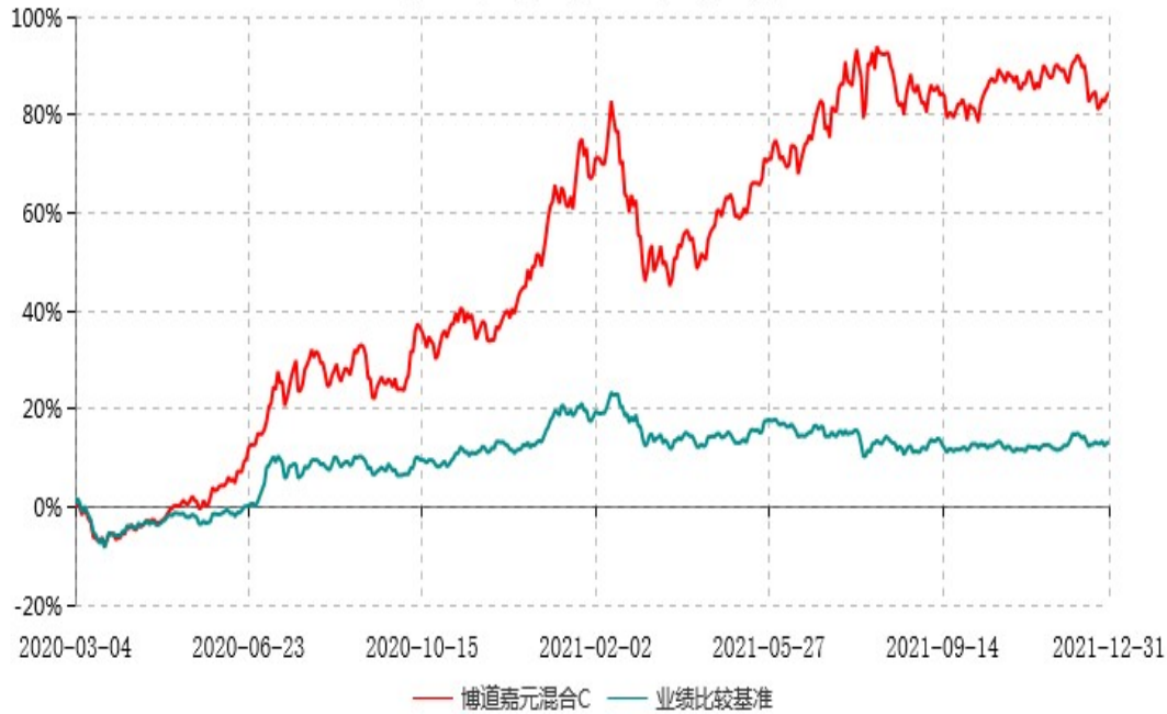
博道嘉元混合C累计净值增长率与业绩比较基准收益率历史走势对比图 (2020年03月04日-2021年12月31日)

注：本基金建仓期为自基金合同生效日起的 6 个月。截至建仓期结束，本基金各项资产配置比例符合基金合同及招募说明书有关投资比例的约定。