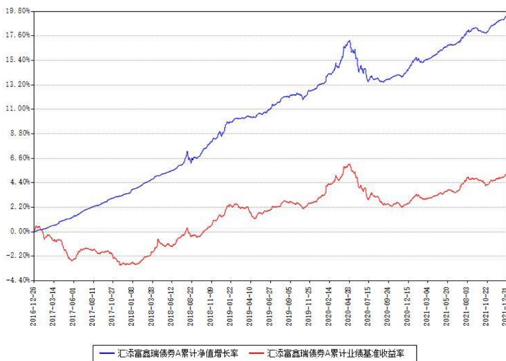
汇添富鑫瑞债券A累计净值增长率与同期业绩基准收益率对比图