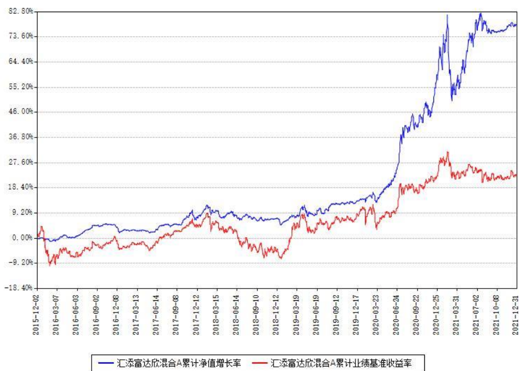
汇添富达欣混合A累计净值增长率与同期业绩基准收益率对比图